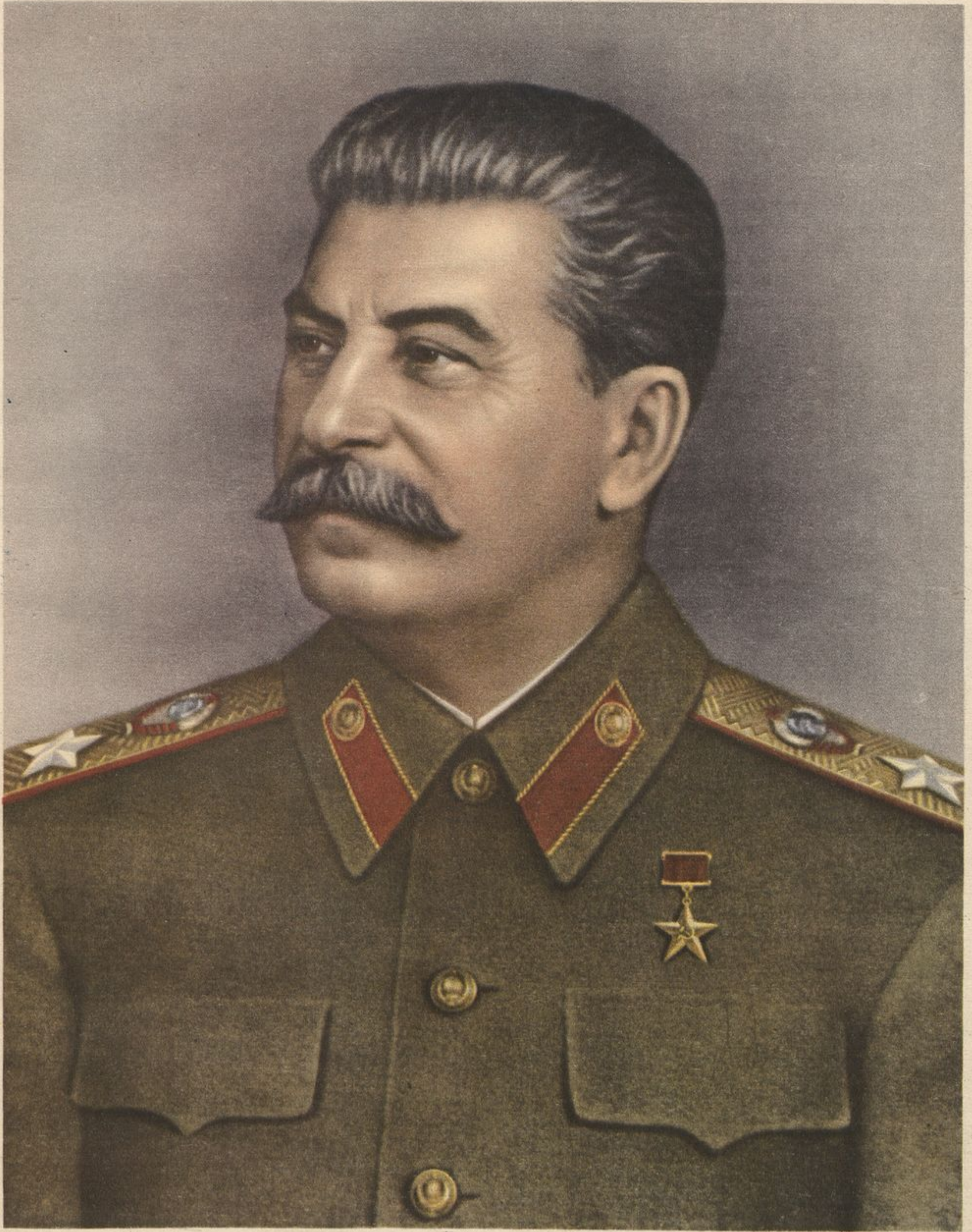
Иосиф Виссарионович Сталин.