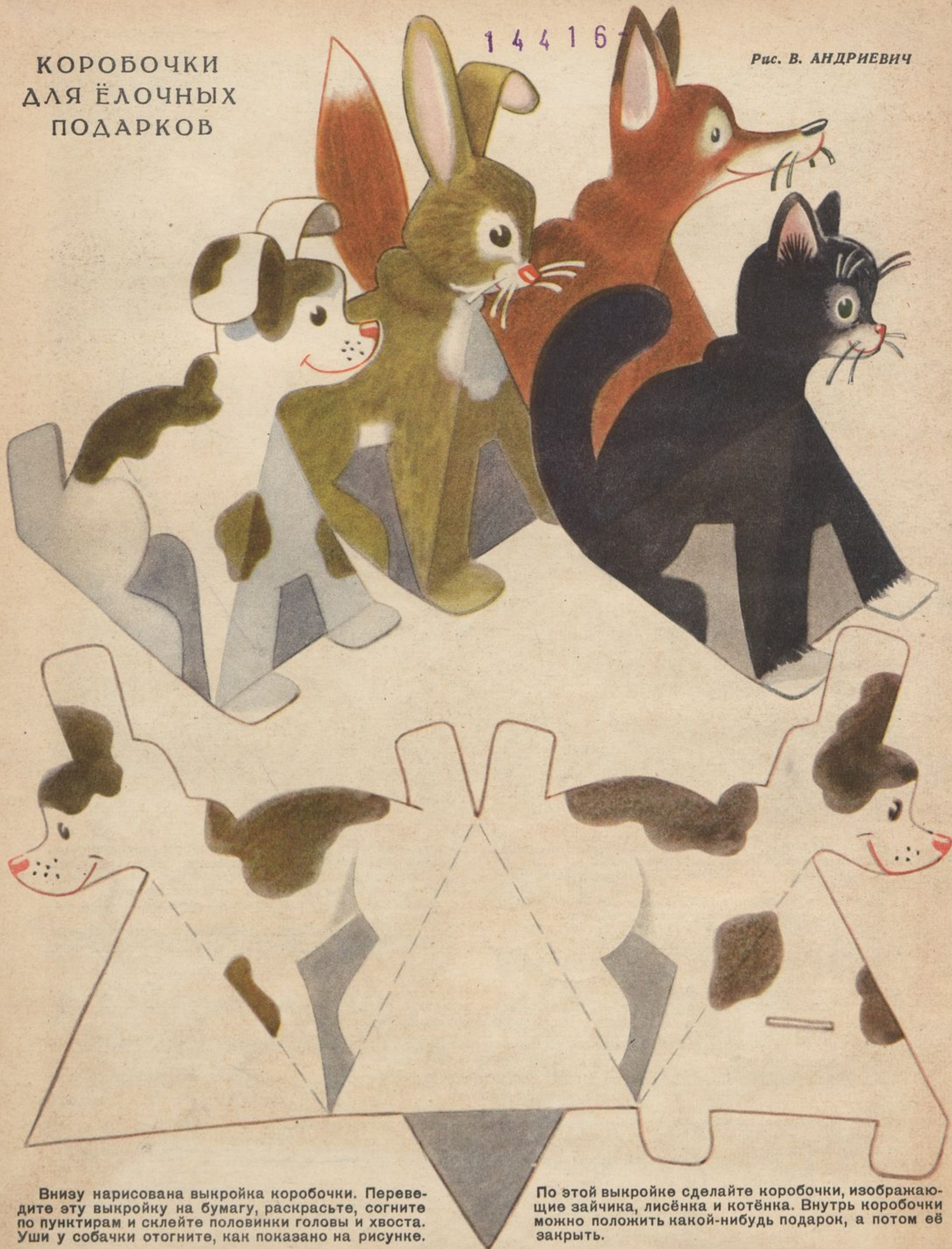
Рис. В. АНДРИЕВИЧ

Внизу нарисована выкройка коробочки. Переведите эту выкройку на бумагу, раскрасьте, согните по пунктирам и склейте половинки головы и хвоста. Уши у собачки отогните, как показано на рисунке.